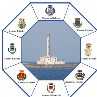
Ambito Sociale di Gallipoli